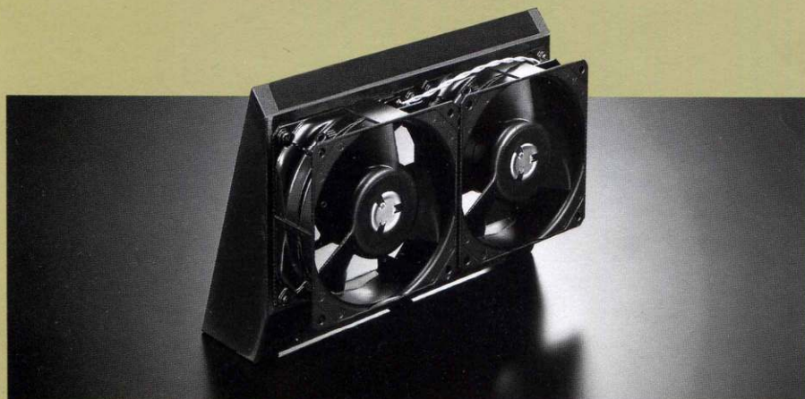
世界でも最も静かなフランス・エトリ社製クーリングファンを4個 OFF/L o /Hiの3段階にコントロール。

ンス変化をする心配は無い。従って理想に近い回路設計が可能となる部分でもある。DMA-X2では先に述べたスタックス・オリジナルの対アース増幅とクラスA増幅、差動入力によるバランス増幅と現在極めて(スタックスとしては標準的)な回路をここには採用している。ではこの部分が音にあまり影響が無いか—といえれば出力段に比較してやや影響が少ない—とは言え決して疎かに設計出来ない部分である。ここにはロー・ノイズ・デュアルFETによる差動入力回路を採用し、オードックスにNFBを掛け、広帯域のフラットな周波数特性を確保している。