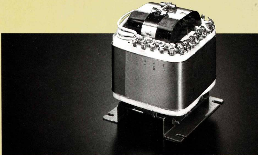
DMA-X2の底力を支える1,500VAの超大型カットコア電源トランス。