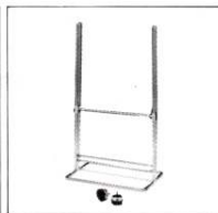
専用スタンド JS-2 ¥18,000