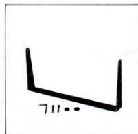
専用壁掛(吊り)金具 HK-1 ¥8,500 (1ペア)

●スタックスはESTA4Uによってコンデンサースピーカーを、より身近なものにしました。ESTA4U EXTRAはセルフバイアス・コンデンサースピーカーESTA4U発音ユニットの固定極間ギャップ幅を拡大して低域でのリニアリティを大幅に改善、凸型バツフル板の採用によりキャビネットの回折現象を防止、リスニングルームの音響特性に合わせて周波数特性が選べるレスポンス・セクター、ディレイ回路による指向性の改善、セルフ・バイアス方式のほか固定バイアス駆動を可能とするアプターEAC-1を付属するなど、このサイズのコンパクト・コンデンサースピーカーに望み得る最大の性能を達成しました。ダイナミック型スピーカーでは得られないクリアなサウンドをESTA4U EXTRAでお楽しみください。