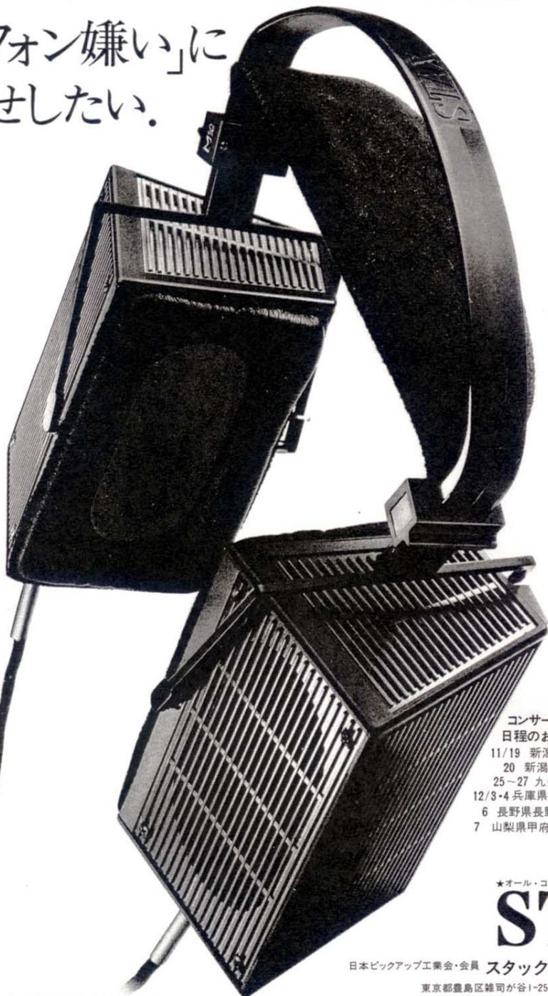
SR-Σ ¥38,000 音場再生イヤースピーカー