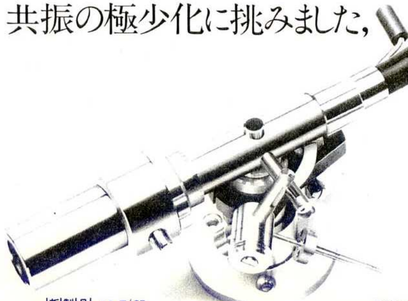
新製品 UA-7/CF マルチユースインテグレートッド・トーンアーム ¥35,500

日本ビクター工業会・会員 スタックス工業株式会社 東京都豊島区雑司が谷1-25-5 ☎03(981)7227(代)〒171 ※製品名ご指定の上、S-5係へカタログをご請求ください。