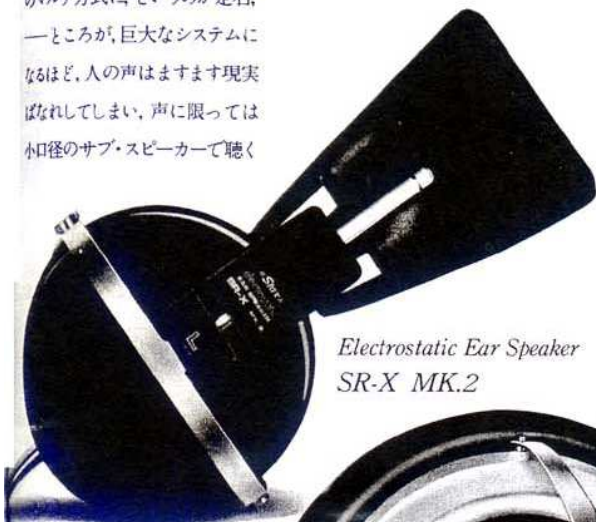
Electrostatic Ear Speaker SR-X MK.2