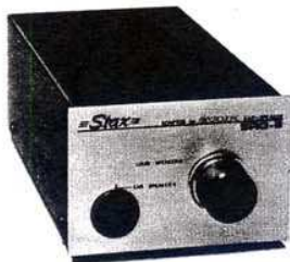
Adaptor for Electrostatic Ear Speaker SRD-6

のNew SR-3、(音の解像力) では最右翼のSR-X/MK.2の 2機種があります。専用アンプ SRA-3S,または、市販アンプに アダプターSRD(SRD-7・ SRD-6)をセットしてお聴き ください。類のない透明な生々 しい音色を楽しめます。