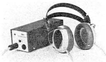
▲ SRD-3 & SR-1